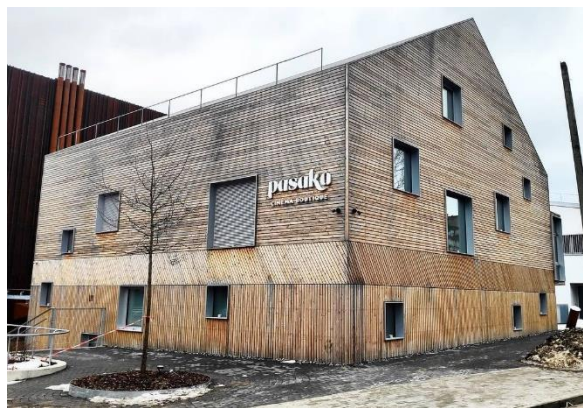
Année de construction 2020, photo 2021, Lituanie. L'orientation des façades peut influencer sur la progression du processus de grisonnement et sur la vitesse de son évolution. La couleur peut parfois devenir partiellement ou complètement noire. Les conditions d'humidité momentanée influent également sur le ton dominant des nuances.