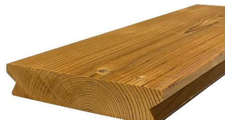
Figure 2: Coté aubier en face visible