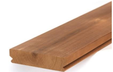
Figure 1: Cœur en face visible

Nos produits en pin sont utilisés du côté du cœur en raison de sa meilleure durabilité (Figure 1). Les propriétés du bois de cœur du pin réduisent le risque de délamination. L'aspect visuel du pin est plus clair en raison de l'espacement des nœuds. Pour l'épicéa, la structure droite du grain du bois réduit les risques de délamination et l'on utilise donc le côté aubier en face apparente (Figure 2). La partie des bois avec des nœuds vivants étant plus longue, elle permet d'utiliser des sections plus larges.