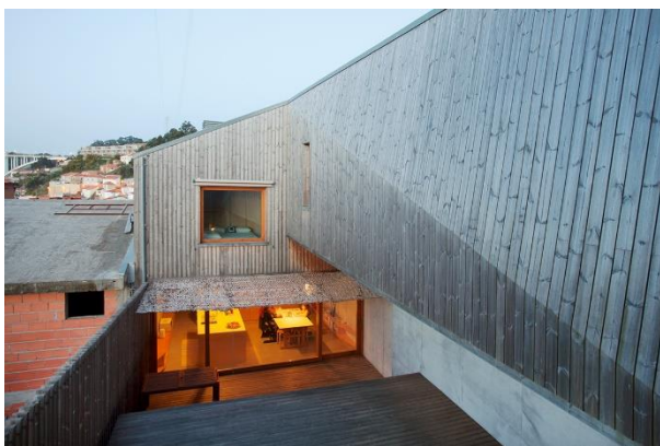
Année de construction 2015, photo 2019, Portugal. La surface a pris une belle teinte gris argenté. La partie du mur dans la zone ombragée a conservé son ton d'origine, tout en ayant légèrement passé.