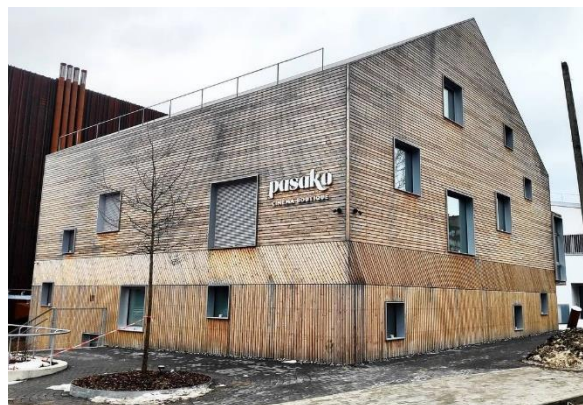
Année de construction 2020, photo 2021, Lituanie. L'orientation des façades peut influencer sur la progression du processus de grisonnement et sur la vitesse de son évolution. La couleur peut parfois devenir partiellement ou complètement noire. Les conditions d'humidité momentanée influent également sur le ton dominant des nuances.