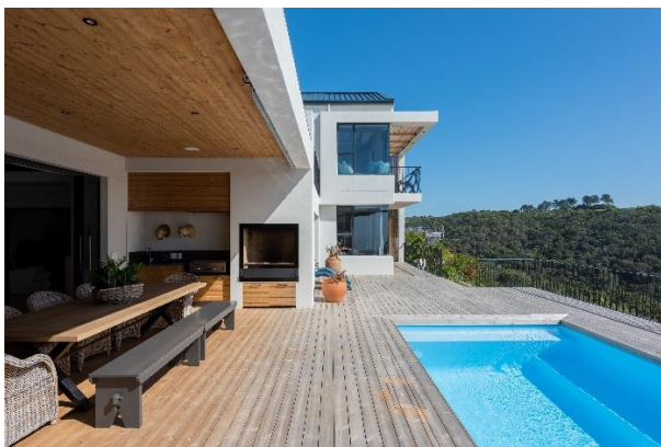
Année de construction, photo 2020, Afrique du Sud. Le processus de grisonnement a commencé. La couleur des planches les plus exposées aux rayons UV commence à s'estomper, avec parfois quelques différences entre elles. Cela est dû aux propriétés inhérentes au bois et à leur variation.