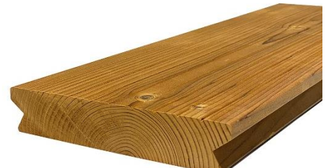
Figure 2: Coté aubier en face visible