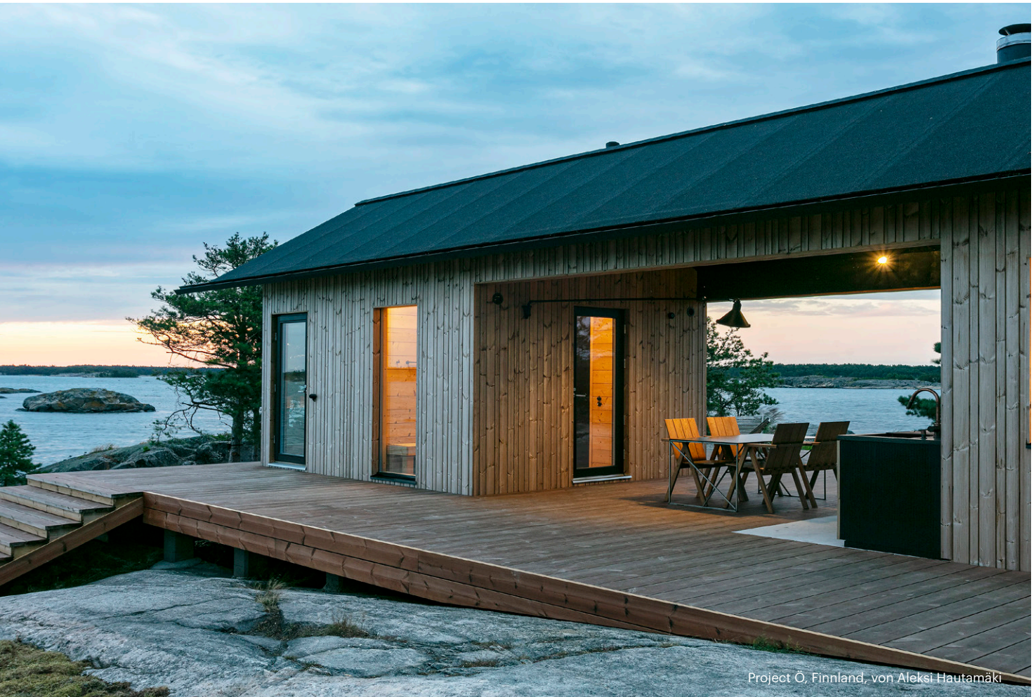
Project O, Finland, von Aleksi Hautamäki