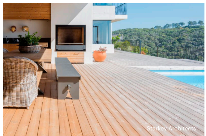
Etelä-Afrikassa sijaitsevan talon terassi on harmaantunut voimakkaasti auringon puolelta, mutta varjoalueet ovat vielä ruskeat.