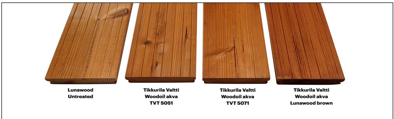
Vertailu Tikkurilan Valtti -öljyistä Lunawood-lämpöpuulla

Huom! Pellavaöljy ei sovelly lämpöpuulle.