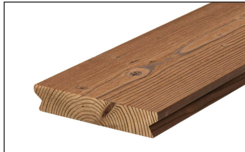
Figure 2: Coté aubier en face visible