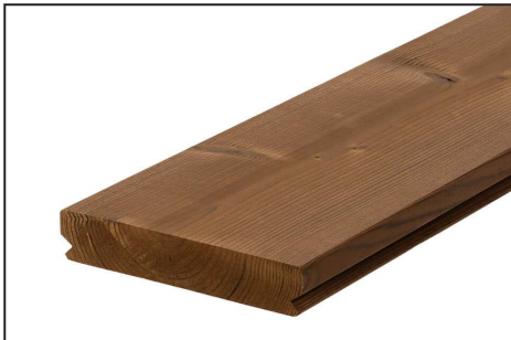
Figure 1: Cœur en face visible

Nos produits en pin sont utilisés du côté du cœur en raison de sa meilleure durabilité (Figure 1). Les propriétés du bois de cœur du pin réduisent le risque de délamination. L'aspect visuel du pin est plus clair en raison de l'espacement des nœuds. Pour l'épicéa, la structure droite du grain du bois réduit les risques de délamination et l'on utilise donc le côté aubier en face apparente (Figure 2). La partie des bois avec des nœuds vivants étant plus longue, elle permet d'utiliser des sections plus larges.