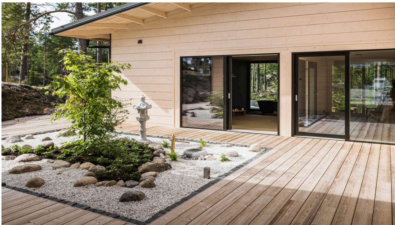
■ Honka Haiku, KOAN Architecture.