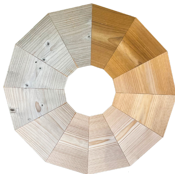
Agrisamiento natural de la tarima Lunawood sin tratar, de marrón a gris, durante 12 meses en Finlandia.

Las impurezas del aire, como el hollín, el polen o el polvo metálico, pueden provocar pequeñas manchas negras en la superficie de la tarima. Estas manchas también pueden ser causadas por hongos cromógenos, especialmente cuando la humedad del aire es alta. En algunos casos, una base de tarima que contiene sulfatos, combinada con agua, puede decolorar la madera. En la tarima que se deja sin tratar, el proceso natural de agrisamiento acabará integrando las manchas negras en la superficie. Sin embargo, es necesario lavar la tarima para eliminar la causa de las manchas. Si la tarima ha sido tratada superficialmente, se recomienda lavarla y volver a aceitarla para eliminar las manchas negras.