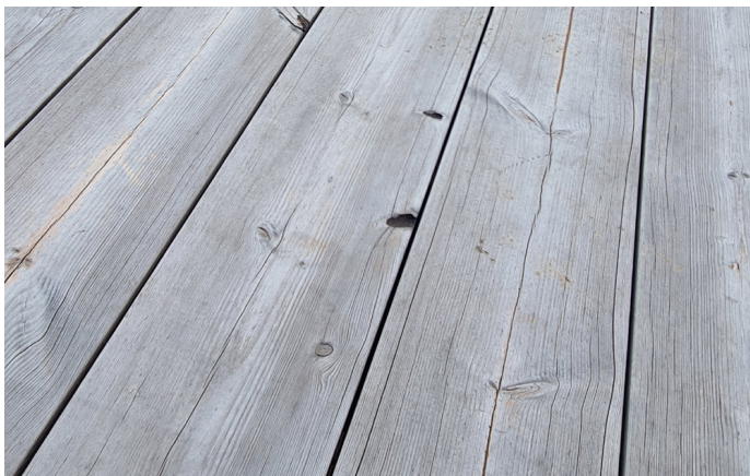
Tarima Lunawood sin tratar, 2 años después de la instalación. Se pueden observar finas grietas superficiales.

Aplicar únicamente sobre una superficie limpia. Debe tenerse cuidado de aplicar solo la presión de agua suficiente para eliminar la superficie decolorada y no levantar la veta de la madera. Siga las instrucciones del fabricante del tratamiento superficial y pruebe siempre el producto para evaluar el resultado antes de aplicar a toda la superficie. Para obtener más información sobre la aplicación y el mantenimiento, póngase en contacto con su proveedor local de tratamientos superficiales para su proyecto.