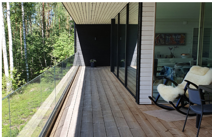
Lunawood-terassi 2 vuotta asennuksen jälkeen. Aurinkoisella alueella terassi on harmaantunut nopeammin verrattuna varjoisaan alueeseen.