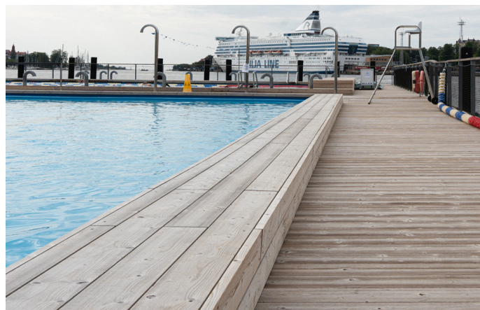
Allas Pool Helsingissä 5 kuukautta asennuksen jälkeen. Tasaisen auringonvalon ja kosteuden vaikutuksesta terassi on harmaantunut nopeasti.