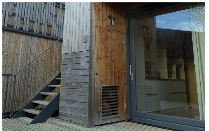
Alankomaissa sijaitseva ulkoverhous kaksi vuotta asennuksen jälkeen. Rakennuksen ilmansuunta vaikuttaa harmaantumisprosessin etene- miseen. Väri voi joskus näyttää osittain tai kokonaan mustalta. Myös kosteusolosuhteet voivat vaikuttaa vallitsevaan sävyyn.