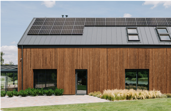
Pintakäsitelty yksityiskoti Puolassa.

Levitä käsittely vain puhtaalle pinnalle. Varmista, että käytetty vedenpaine on vain sen verran voimakas, että värjäytynyt pinta saadaan poistettua eikä puun syy nouse pystyyn. Noudata pintakäsittelyaineen ohjeita ja testaa tuote aina etukäteen lopputuloksen arvioimiseksi. Saat lisätietoja levityksestä ja huollosta ottamalla yhteyttä paikalliseen pintakäsittelytuotteiden toimittajaan projektiasi varten.