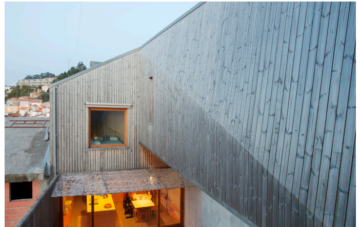
Portugalissa sijaitseva ulkoverhous 4 vuotta asennuksen jälkeen. Pinta on saanut kauniin hopeanharmaan sävyn.